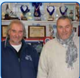
Gebr. Fanger Badhoevedorp