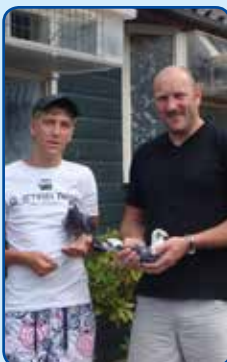
John Rekers & Zoon Amersfoort