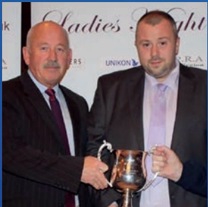
Gibb & Sons (IRL)

Wöchentliche hervorragende Ergebnisse auf lokaler und Provinzebene im Jahr 2016