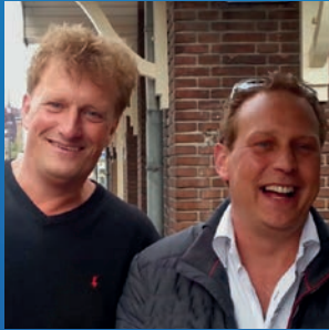
Team GPS (NL)

1.4.14. National Asstaube Mittelstrecke K.B.D.B. 2015 14. National Asstaube Mittelstrecke K.B.D.B. 2016