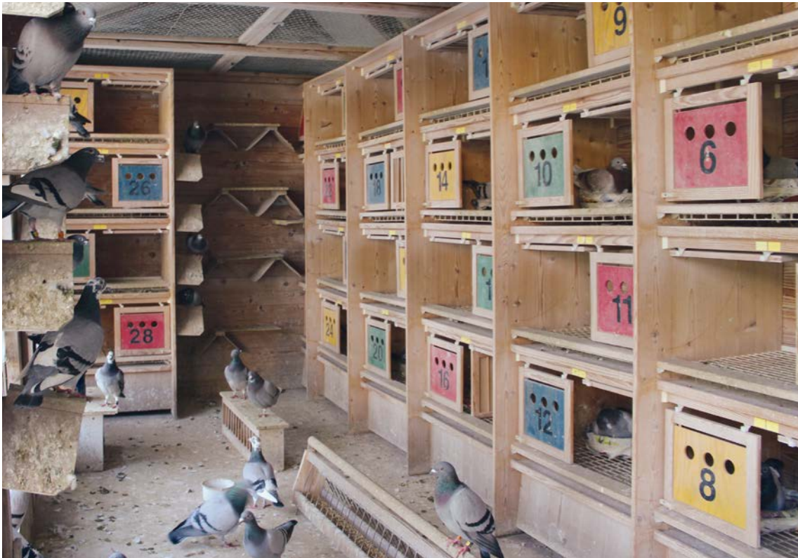
Blick in den gesamten Reiseschlag von Hans Lekscha in Wuppertal. Hier kommen nur die erlesenen Futtermischungen aus dem Hause Beyers zum Einsatz.

Grandprix'. Die Alttauben werden immer satt gefüttert (den Rest bekommen die Zuchttauben). Am Einsatztag wird ‚Superdiät‘ oder ‚Zootjens gelb‘ bis zum Einkorben gegeben sowie die erste Mahlzeit nach dem Flug. Abends bekommen sie ‚Prange Grandprix‘ mit ‚Zell Oxygen‘ und ein Mineralpulver. Am nächsten morgen gibt es wieder ‚Prange Grandprix‘ und ‚Galaxy Sport-Energy‘. Die neue Mischung ‚Galaxy Sport-Energy‘ kommt von Dienstag bis Donnerstag zum Einsatz. Nach schweren Flügen wird etwas Hanf beige-mischt. Ab 400 km, gebe ich zum Ende der Woche mehr ‚Galaxy Sport-Energy‘ und noch Cribbs-Mais zusätzlich. Mittwochs bekommen die Tauben Jod. Das ganze Jahr erhalten die Tauben täglich frischen Grit, hier mischen wir die beiden Beyers-Gritmischungen ‚Deli Multimix‘ und ‚Urtica Chlorella Mineral Mix‘ zusammen. Die Picktöpfe rot und grau stehen immer zur Verfügung. In den letzten 5 Jahren wurden den Tauben keine Medikamente gegeben (ausgenommen Jungtauben-Krankheit). Die Tauben fliegen mit diesem System bis zum Ende der Saison sehr gut.“