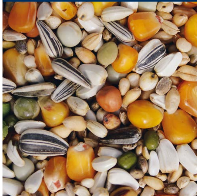
Prange Grand Prix

Beyers „Prange Grand Prix“ ist eine einzigartige hochwertige Mischung, die sehr vielseitig und außerordentlich reich an Nährstoffen und damit ideal für den modernen Taubensport ist. Die Mischung enthält nicht weniger als 21 verschiedene Bestandteile, darunter 25 % Cribbs-Mais und kleiner Cribbs-Mais, 9 % Hanf und exklusive Samen wie Quinoa und Sesam. Mit einem Gehalt von 14,51 % Roheiweiß und von 9,82 % Rohfett bietet Ihnen „Prange Grand Prix“ die Möglichkeit, maximale Leistung aus den Tauben herauszuholen.